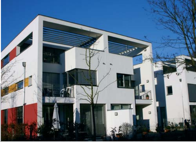
20 Einfamilienhäuser in Köln Junkersdorf, 2003