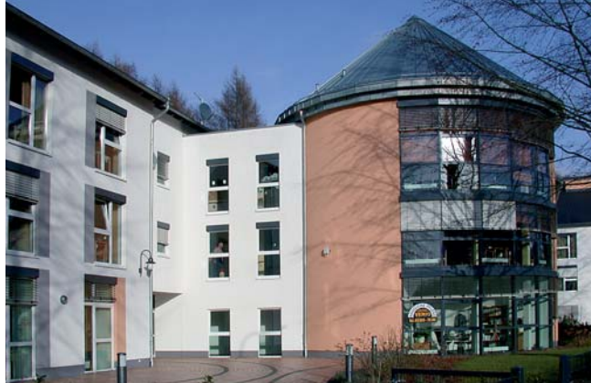
Seniorenzentrum in Odenthal, 2004