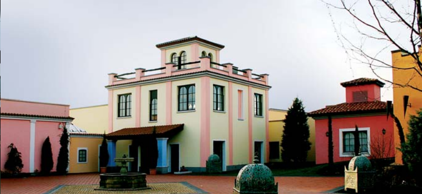
Mediterrana, Erholungs- und Wellnessbad mit mediterranem Flair in Bensberg, 2004