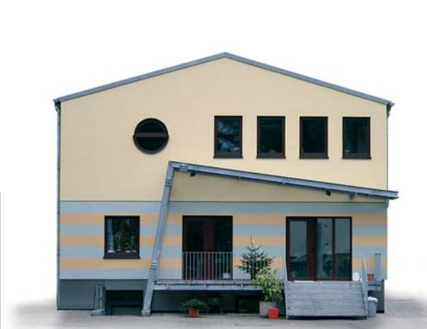
Tierheim in Köln Dellbrück, 2004