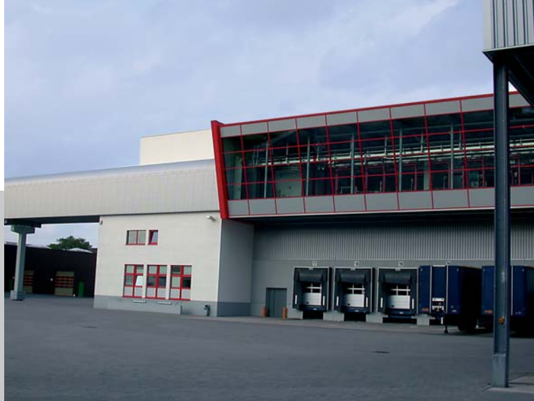
Krüger Zentrallager in Bergisch Gladbach, 2003