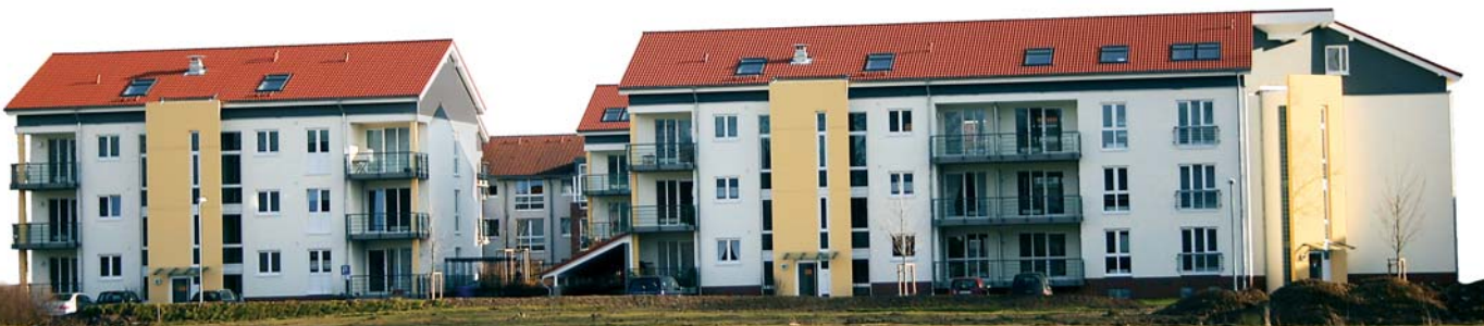
Fünf Mehrfamilienhäuser in Leverkusen / Schlebusch, 2004

Industrie: Krüger Adels Contact m-real Zanders Motorenfabrik der Fa. Humboldt Wedag Stadtwerke Bonn Bayer AG Deuta Werke Tyco Total Walther Feuerschutz P&O Johnson Controls Saint-Gobain Isover G + H Tower Automotive AlstomPower Boiler