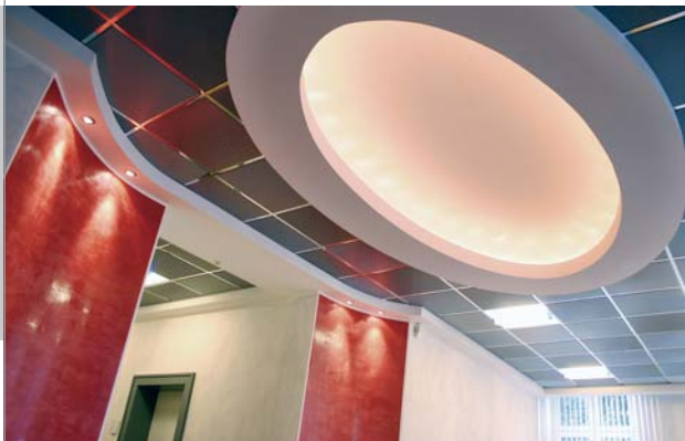
Empfang Firma Dörrenberg in Engelskirchen, 2004