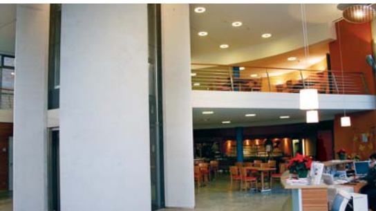
Evangelisches Krankenhaus in Bergisch Gladbach, 2003/2004. (Wärmedämmung, Innen- und Außenputz, Malerarbeiten, Türen, Brandschutz, Trockenbau, Akustikdecken)