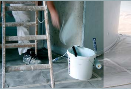
Villa in Bergisch Gladbach. Die Fassade wurde komplett saniert.