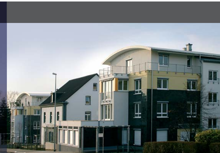
Zwei Mehrfamilienhäuser in Bergisch Gladbach / Bensberg, 2004