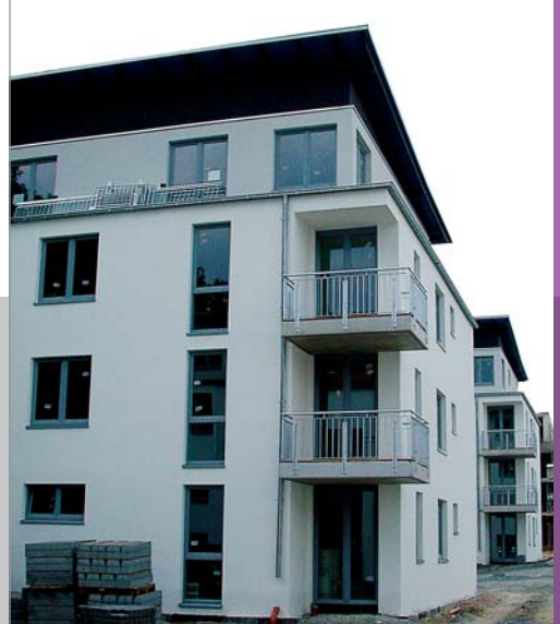
Hermann-Löns Neubaugebiet in Bergisch Gladbach, 2003/04