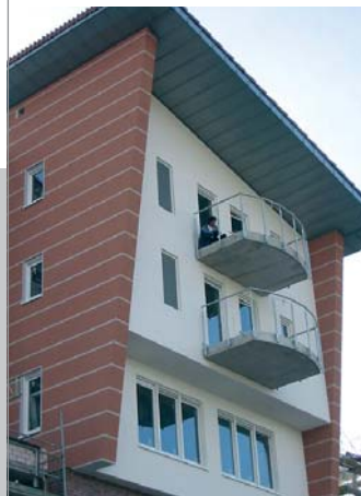
Seniorenhaus mit 80 Wohnungen in Dortmund, 2004