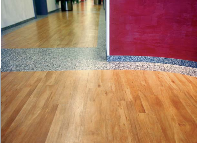
Empfang Firma Dörrenberg in Engelskirchen, 2004